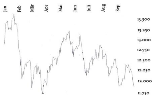
Deutscher Aktienindex DAX

die deutsche Aktienbörse hat auch im 3. Quartal ihren Abwärtstrend fortgesetzt. Gemessen am Deutschen Aktienindex DAX sind die Kurse seit Jahresanfang um 5,2 % auf 12.247 Punkte gefallen. Nach dem positiven Jahresstart mit dem neuen Allzeithoch am 23. Januar bei 13.560 Punkten wurden die Notierungen immer wieder von Negativnachrichten belastet. Deutschen Unternehmen drohen Belastungen sowohl aus Strafzöllen der USA auf europäische Produkte, als auch aus chinesischen Strafzöllen auf amerikanische Produkte, da sie häufig wie z.B. die Automobilhersteller aus amerikanischer Produktion nach China exportieren. Ferner belastet die realitätsferne Wirtschafts- und Steuerpolitik der italienischen Regierung den gesamten Euroraum ebenso wie der näher rückende Brexit-Termin.