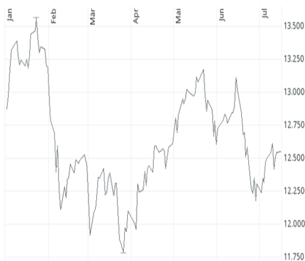
Deutscher Aktienindex DAX

im 1. Halbjahr 2018 sind die Aktienkurse gemessen am Deutschen Aktienindex DAX um 4,7 % auf 12.306 Punkte gefallen. Der Start in das Jahr verlief positiv und am 23. Januar erreichte der DAX bei 13.560 Punkten ein neues Allzeithoch. Der drohende Handelskrieg, die Unstimmigkeiten innerhalb der EU und die Regierungskrise in Deutschland sorgten aber immer wieder für Unsicherheit unter den Anlegern, weshalb sich der DAX in den folgenden Monaten innerhalb einer Bandbreite von 11.800 bis 13.100 Punkten nur seitwärts bewegte.